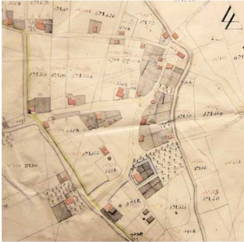
Alb. 15 Verpondingskaart uit 1810 met de herberg van Herman Hasenakker.

Uit het feit dat er in dit stuk over een lengte van 48 voeten, ongeveer 14,5 meter, een muurtje voor het huis moet komen, kunnen we opmaken dat het pand minimaal 14,5 meter lang moet zijn geweest.