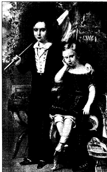
Afb. 10-3. Twee zoons van Willem III uit zijn eerste huwelijk met Sophia van Wurtemberg. Kroonprins Willem Nicolaas Alexander (staand) overleed in 1879 en prins Maurits overleed reeds in 1850.