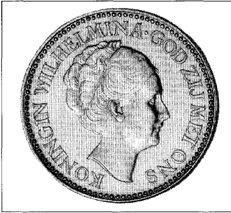
Afb. 10-9. Tien gulden, goud. Diameter 22,5 mm, 1925.

afgevaardigden sturen. Het gemeentebestuur vroeg aan de verenigingen 1 cent per lid te willen bijdragen. Het ontbrekende bedrag werd uit de gemeentekas bijgesteld. De drie jeugdige afgevaardigden droegen de gemeentevlag met zich mee. Net als in veel andere gemeenten hebben ook B & W van Gendt in 1938 zo'n vlag laten maken.