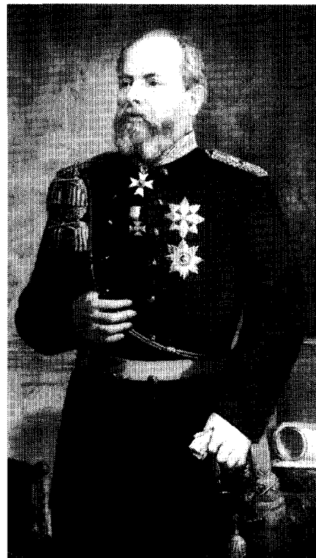
Afb. 10-7. Koning Willem III, de vader van Wilhelmina omstreeks 1867, geschilderd door Herman ten Kate.

De anderen gingen naar één van de lokalen in de school dat 'smaakvol' versierd was. Daar werd muziek gemaakt, gezongen en gedanst. De correspondent van weekblad De Betuwe noemde fijntjes dat men 'Deftige hoeden (...) zag tussen gewone