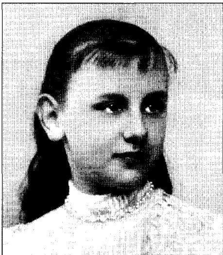
Afb. 10-6. Wilhelmina in 1894, op 14-jarige leeftijd.

moeder overleed als gevolg van de festiviteiten. Eén van de activiteiten was paalklimmen. Daarvoor was een zes meter hoge mast opgericht. Aan de dwarsbalk bovenaan de mast hingen de prijzen. De hoofdprijs, een zilveren horloge, was beschikbaar gesteld door de gemeente Bemmél. Om het de deelnemers extra moeilijk te maken was de paal ingesmeerd met groene zeep. De jongeman klemde zich tegen de paal en worstelde zich onder aanmoedigingen van het publiek naar boven. Met een uiterste krachtsinspanning wist hij het horloge te pakken te krijgen.