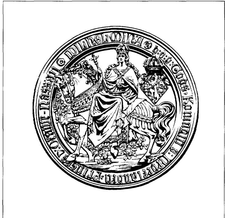
Afb. 6. Het zegel van Wilhelmina, getekend door de heraldicus T. van der Laars.

Naast de reguliere verspreiding van dit speciale Wilhelmina-nummer aan de leden van de aangesloten verenigingen zijn ze beperkt verkrijgbaar bij de erkende boekhandels in de Betuwe voor de prijs van f 14,95. ■