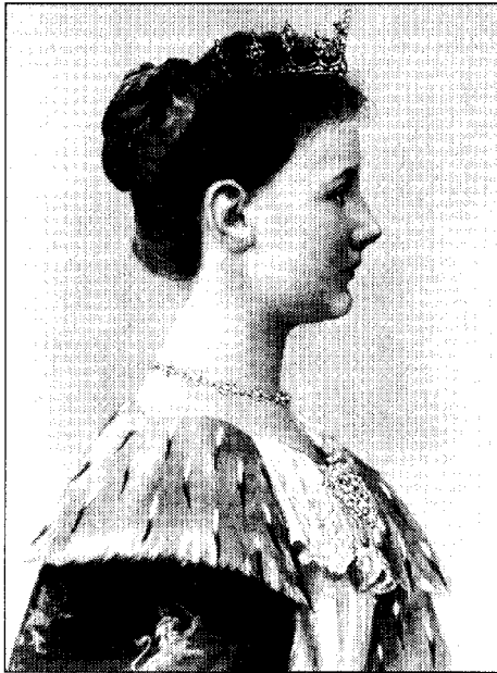
Afb. 10-4. Koningin Wilhelmina in het jaar van de inhuldiging.