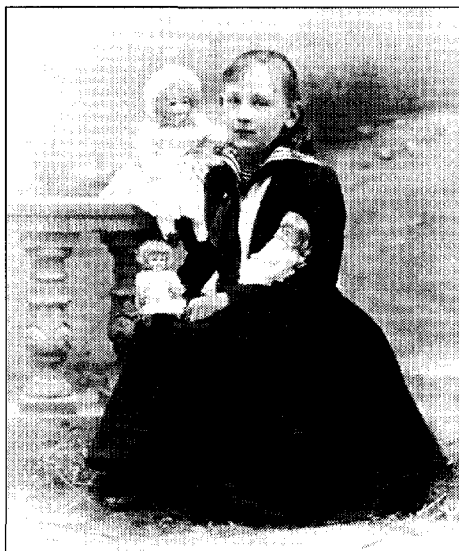
Afb. 10-2. Wilhelmina in 1892.