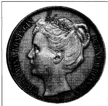
Afb. 10-5. Rijksdaalder, 1898, zilver, diameter 38 mm.