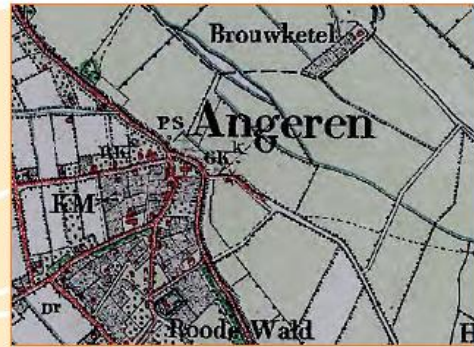
Historische kaart 1890