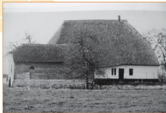
Boerderij met vloedschuur rond het midden van de 20ste eeuw