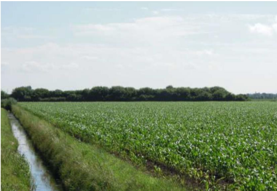
Afb. 36 (E) De oude loop van de Linge tussen Gendt en Angeren. Een strook met opgaand geboomte markeert de plaats waar ooit de Linge stroomde, of beter: de Waalwetering en Rijnwetering. Mogelijk gaat het hier om de oude Weteringsewal, tussen beide weteringen, die na het verleggen van de Linge in de jaren 1950 aan zijn lot is overgelaten en vol gegroeid is. De locatie is niet te bereiken, anders dan door het bouwland. Rechts is in de verte nog net een enkele toren van kasteel Doornenburg zichtbaar, dat deze contreien al eeuwen bewaakt. De kades overtreffen het kasteel echter hoogstwaarschijnlijk in ouderdom.

Wanneer je aan het eind van de Kampsestraat rechtsaf het Linge fietspas op rijdt of wandelt, bevindt zich in de volgende min of meer haakse bocht voor het bruggetje richting Haalderen/Bemmel links de 'samenkomst' van de vroegere Waalwetering en de Rijnwetering. Dit gebied is gemarkeerd door een verbreding van de Linge, in de vorm van een min of meer vierkante waterpartij met eilandje en (riet)begroeiing. Maar het meest zichtbaar is het oude tracé nog wel vanaf de Gendtse kant; vanuit de Broeksestraat.